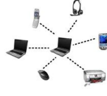
১ নং চিত্র