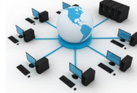
৩ নং চিত্র