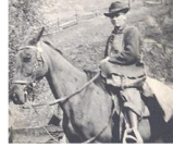
২ নং চিত্র